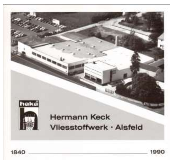
Deckblatt der Jubiläumsbroschüre

In einer Zeit, die charakterisiert ist durch gesellschaftliche wie wirtschaftliche Veränderungen, ist es umso bedeutungsvoller, einer 150-jährigen Firmengeschichte zu gedenken.