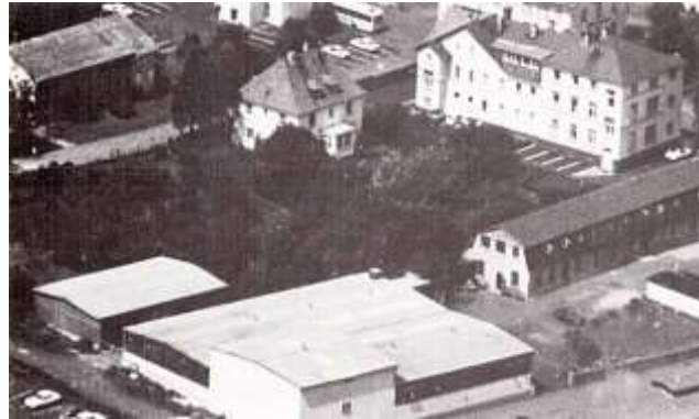
Firma Hermann Keck Vliesstoffwerk

Neben eingeklebten Stoffproben verzeichnet es die jedem Weber übergebenen Kett- und Schussgarne en detail: die sogenannten „Zettel“, die farbigen Garne und Spulen sowie Mängel und Beanstandungen bei Ablieferung gewebter Stücke. Nicht selten vermerkte der Alsfelder Kaufmann falsches Ellenmaß oder Gewicht, Fadenbruch, Fettflecken oder Löcher im Gewebe, was zu Lohneinbußen beim Heimweber führte.